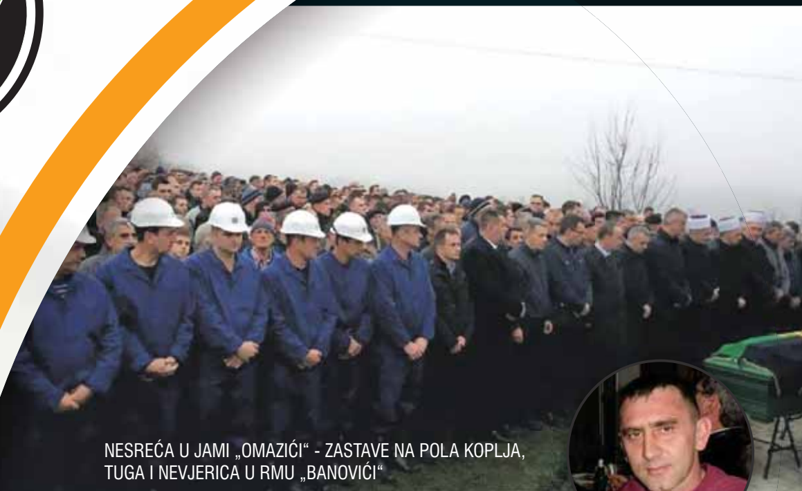
NESREĆA U JAMI „OMAZIĆI“ - ZASTAVE NA POLA KOPLJA, TUGA I NEVJERICA U RMU „BANOVIĆI“